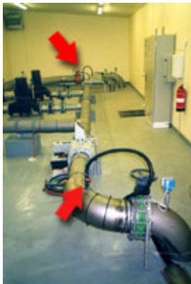
Vista interna della stazione di pompaggio (la freccia indica il punto di dosaggio)