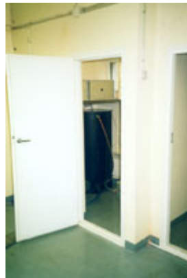
Vista esterna del sistema di Disinfezione dell'Acqua Enviolyte