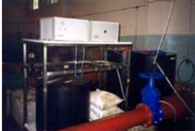
Vista generale del sistema di Disinfezione dell'acqua Enviolyte