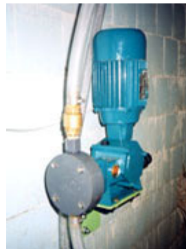
Pompaggio dell'Anolyte Nella tubatura