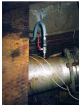
Punto di dosaggio dell'Anolyte