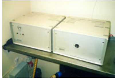
Vista del sistema di disinfezione dell'acqua Enviolyte