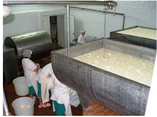
Il casaro esegue il controllo dopo il primo trattamento, a destra la prima unità di trattamento