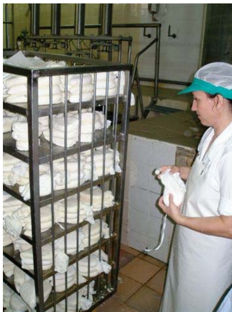
Confezionamento e sagomatura