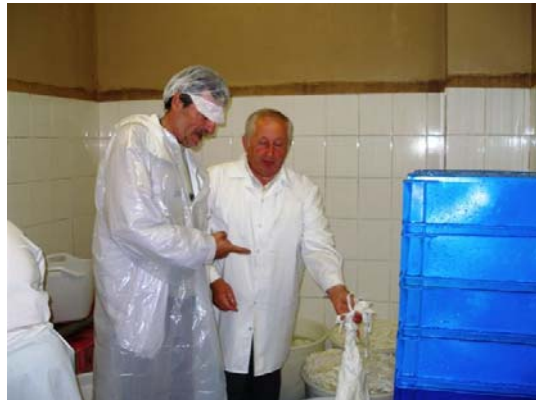
Deposito e area di pulizia delle pezze