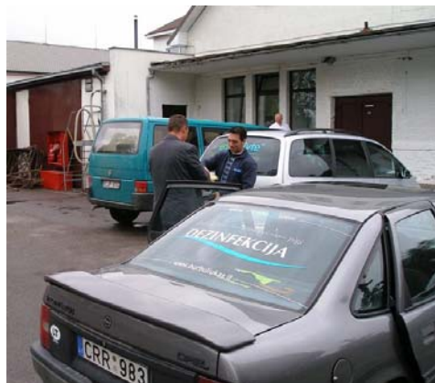
Area di produzione e uffici

Un vivo ringraziamento al personale del caseificio per il caldo benvenuto e le utili informazioni forniteci.