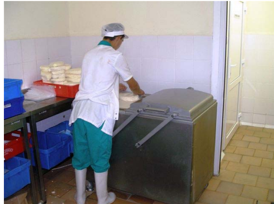
Pressa e confezionamento sotto vuoto