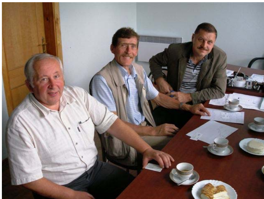
A sinistra il production manager, a destra il proprietario