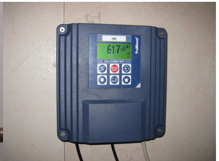
Unità di controllo Redox