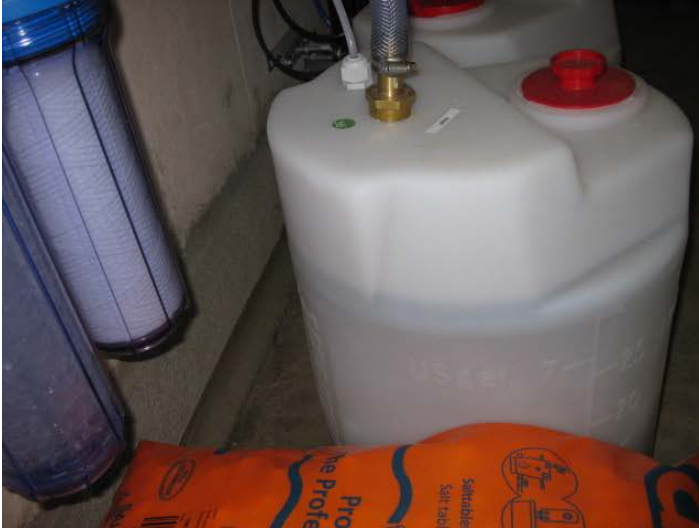
Serbatoio della salamoia

Motivi della scelta della tecnologia ecologica: Il complesso residenziale è stato costruito con totale considerazione dell'impatto ambientale e pertanto il costruttore ha selezionato la tecnologia che ha considerato essere la più amica dell'ambiente.