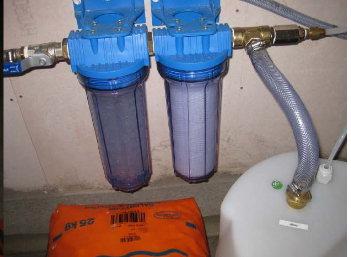
Polifosfati e filtro da 10 micron