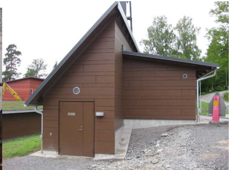
Stazione di pompaggio