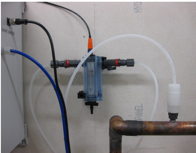
Sonda Redox e punto di iniezione